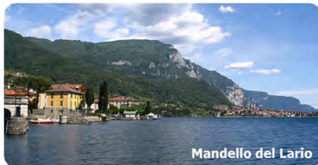
Mandello del Lario